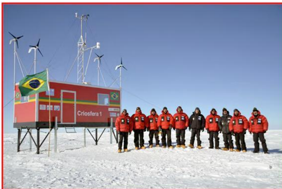
Fotografia 1: Inauguração do módulo Criosfera 1 (12 de janeiro de 2012).